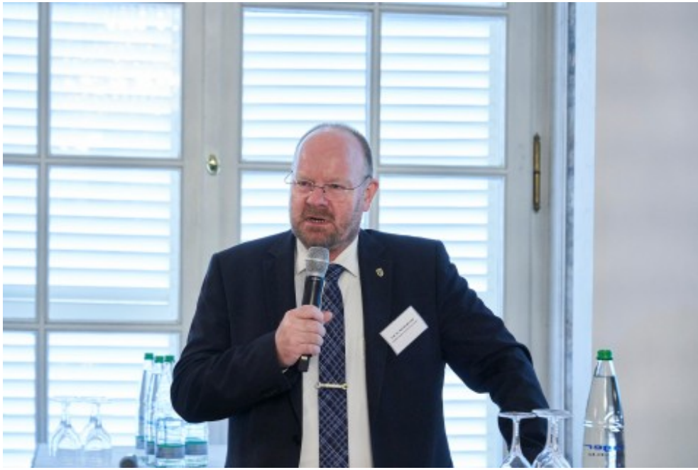
Impressionen vom 4. Bioökonomietag