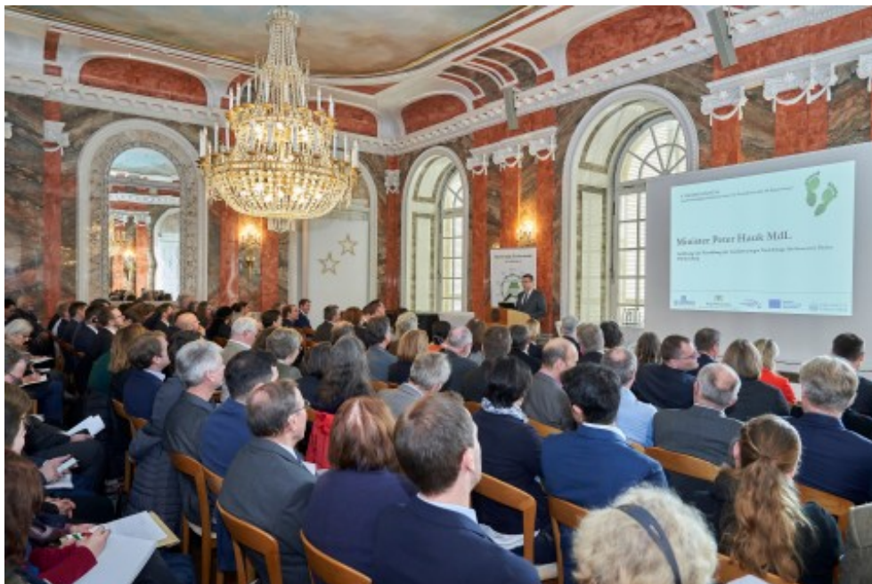
Impressionen vom 4. Bioökonomietag