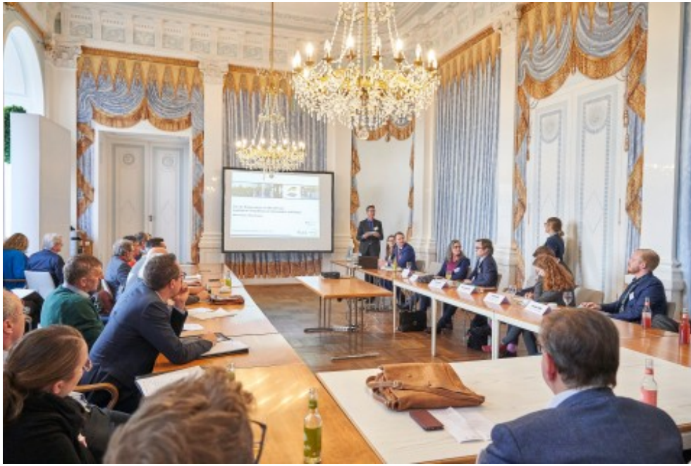
Impressionen vom 4. Bioökonomietag