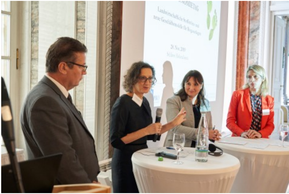
Impressionen vom 4. Bioökonomietag