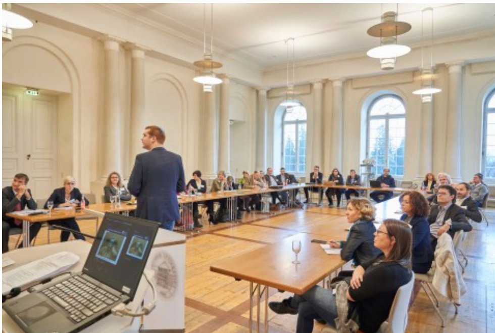
Impressionen vom 4. Bioökonomietag