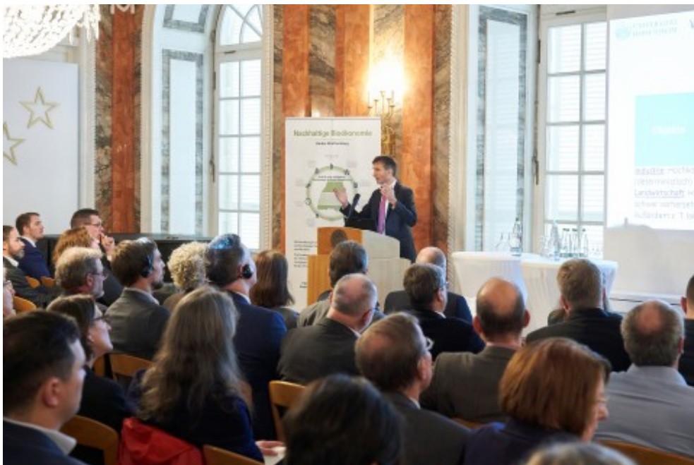
Impressionen vom 4. Bioökonomietag