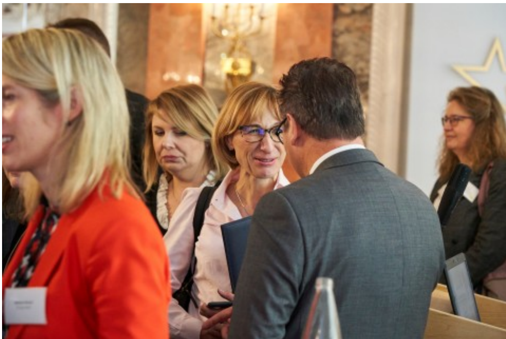
Impressionen vom 4. Bioökonomietag