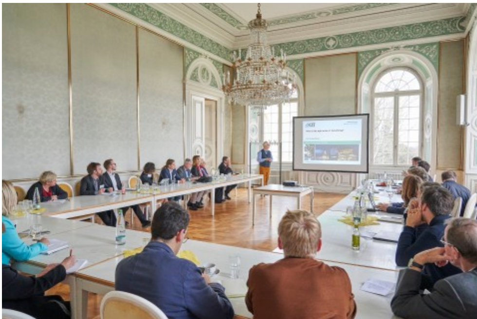
Impressionen vom 4. Bioökonomietag