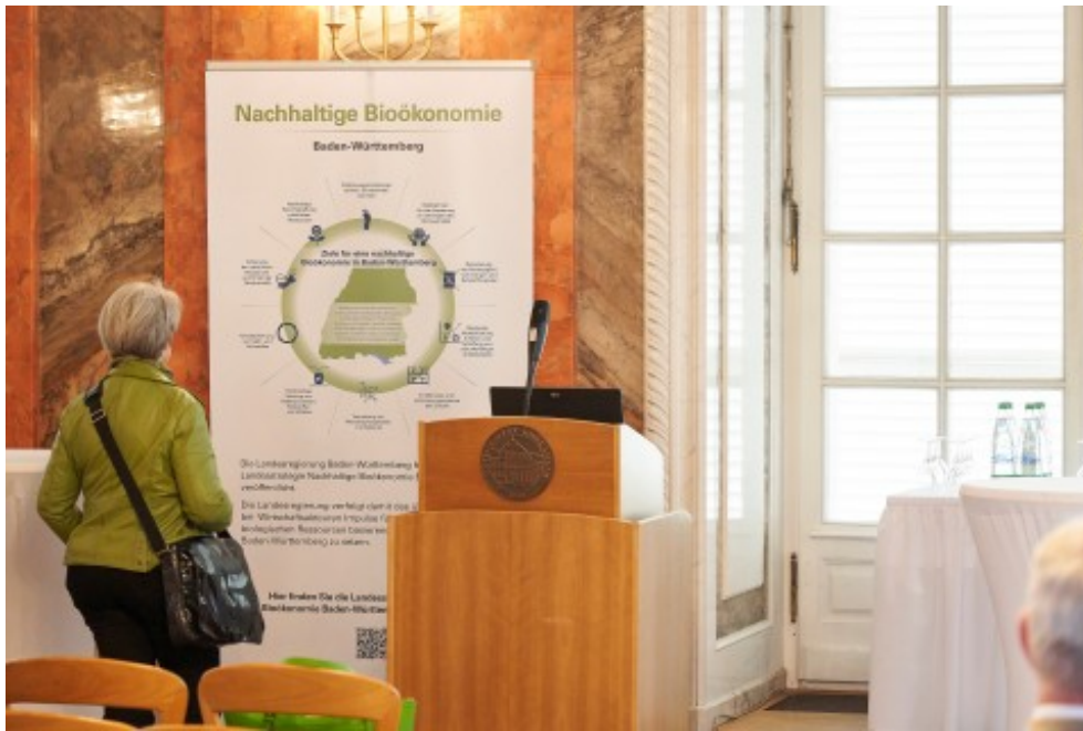
Impressionen vom 4. Bioökonomietag