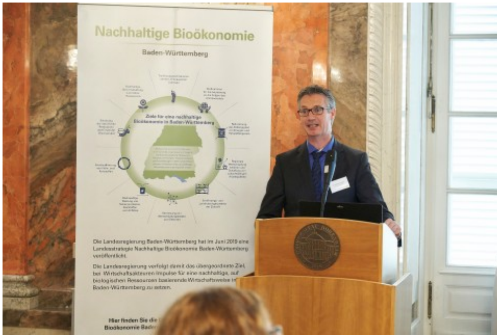
Impressionen vom 4. Bioökonomietag